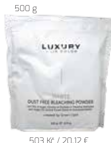
500 g 503 Kč / 20,12 € za kus