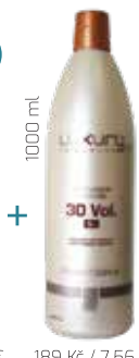
1000 ml 189 Kč / 7,56 € za kus