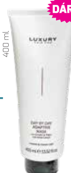
400 ml 330 Kč / 13,20 € za kus