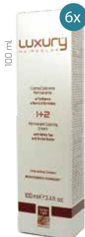
100 ml 166 Kč / 6,64 € za kus

Při nákupu 6 kusů barev Green Light, dostanete oxid Green Light jako dárek zdarma.