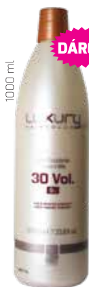
1000 ml 189 Kč / 7,56 € za kus