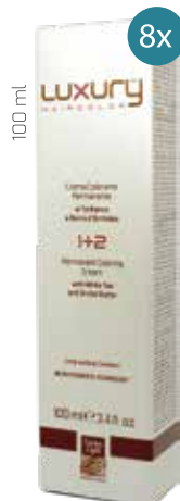
100 ml 166 Kč / 6,64 € za kus

Při nákupu 8 kusů barev Green Light, dostanete Flexi Eco lak jako dárek zdarma.