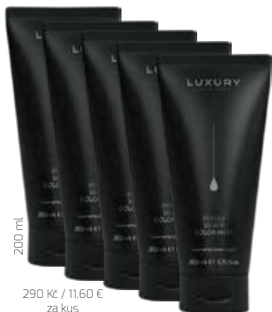
200 ml 290 Kč / 11,60 € za kus