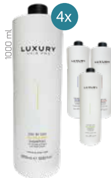
1000 ml 399 Kč / 15,96 € za kus

Při nákupu 4 kusů šamponů Day By Day (1000 ml), získáte od nás masku Adaptive (400 ml) jako dárek zdarma.