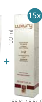
15x 100 ml 166 Kč / 6,64 € za kus